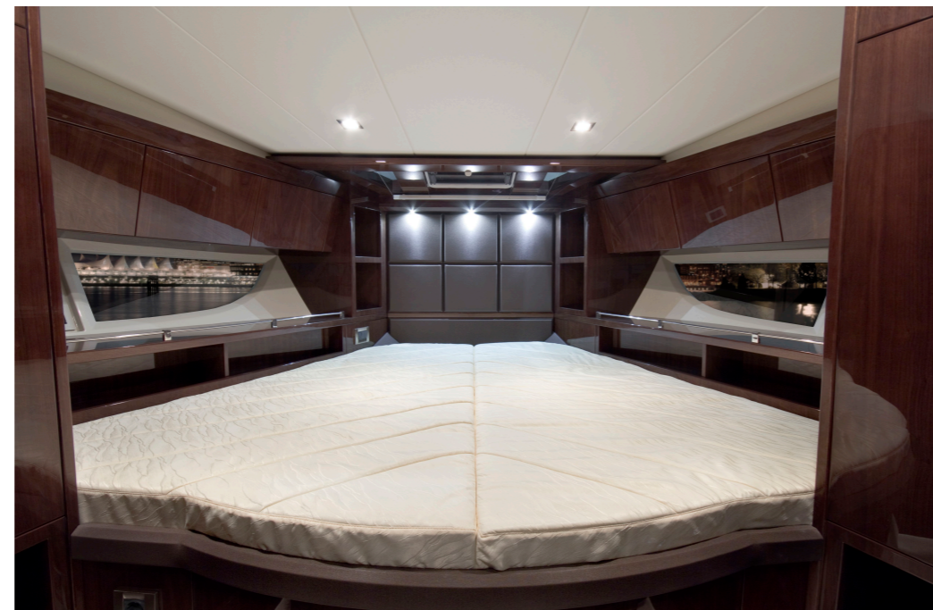
La luxueuse cabine propriétaire