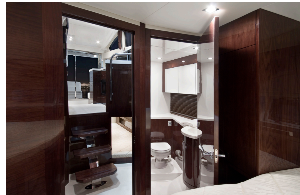
Jusqu'à trois cabines disponibles