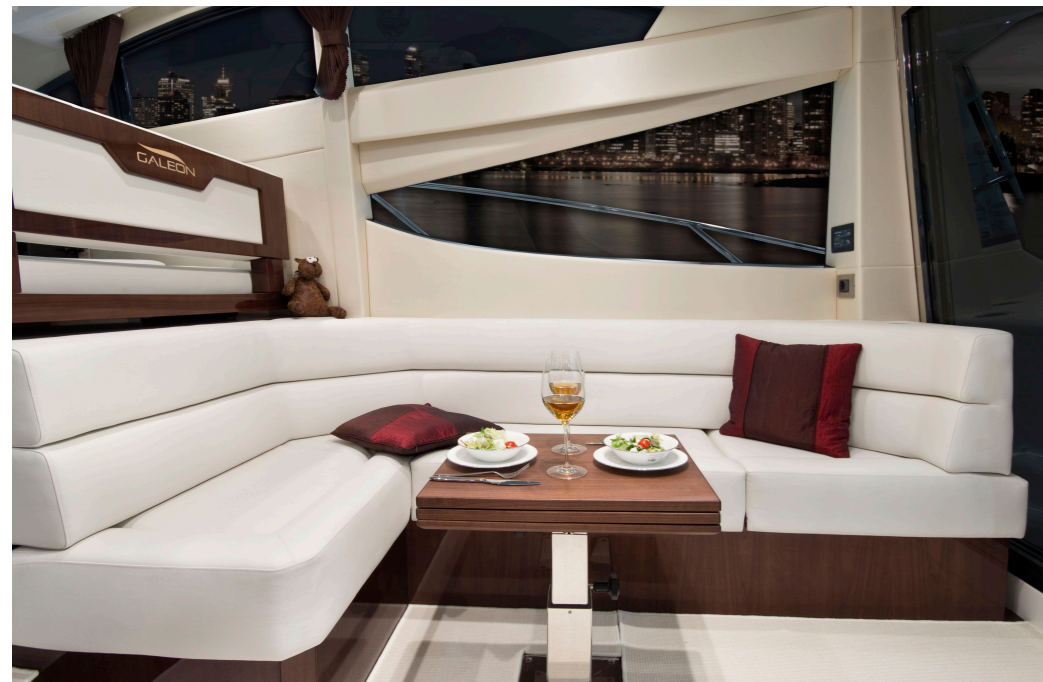
Le carré convivial