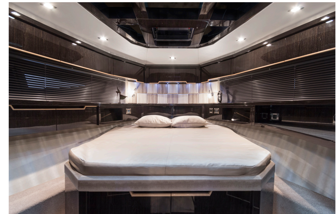
La cabine VIP à l'avant est un véritable écrin