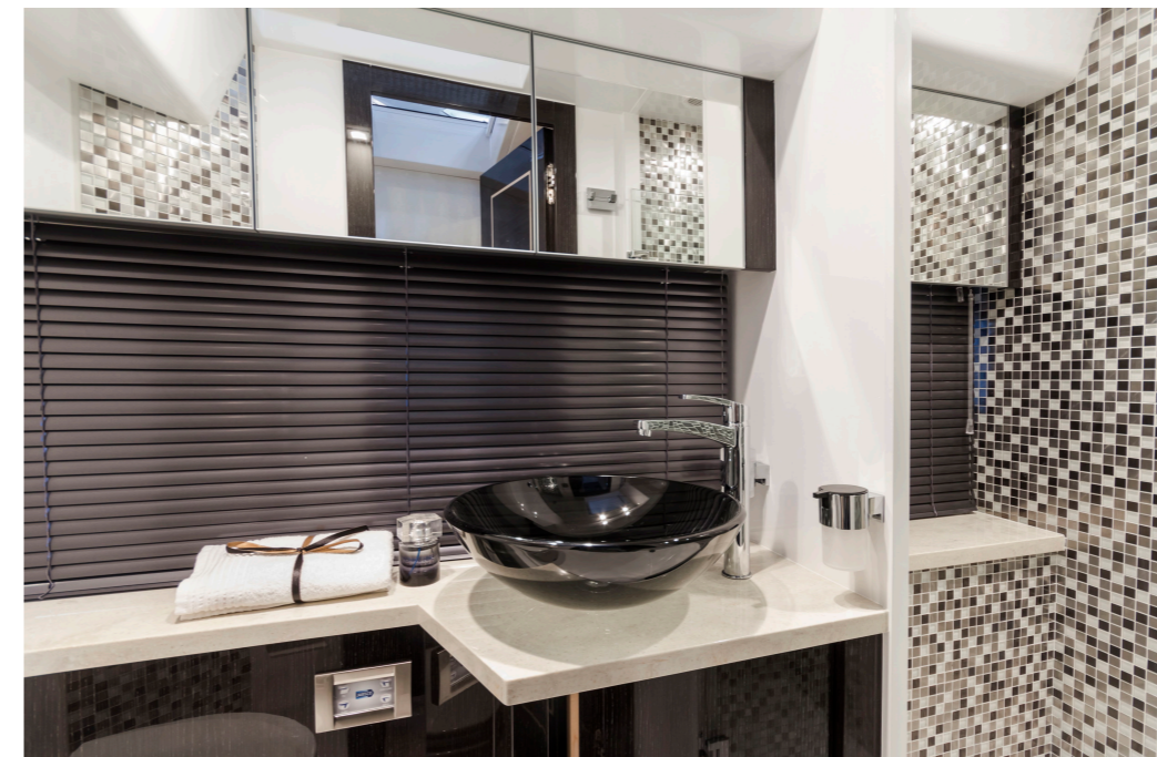
Deux grandes salles de bain avec douche murale sont à disposition