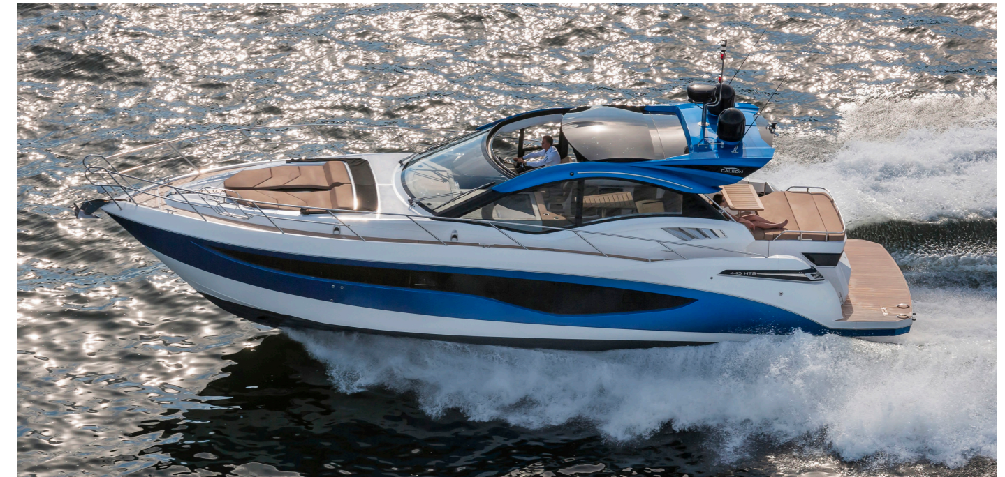
La rencontre de l'élégance et de la sportivité